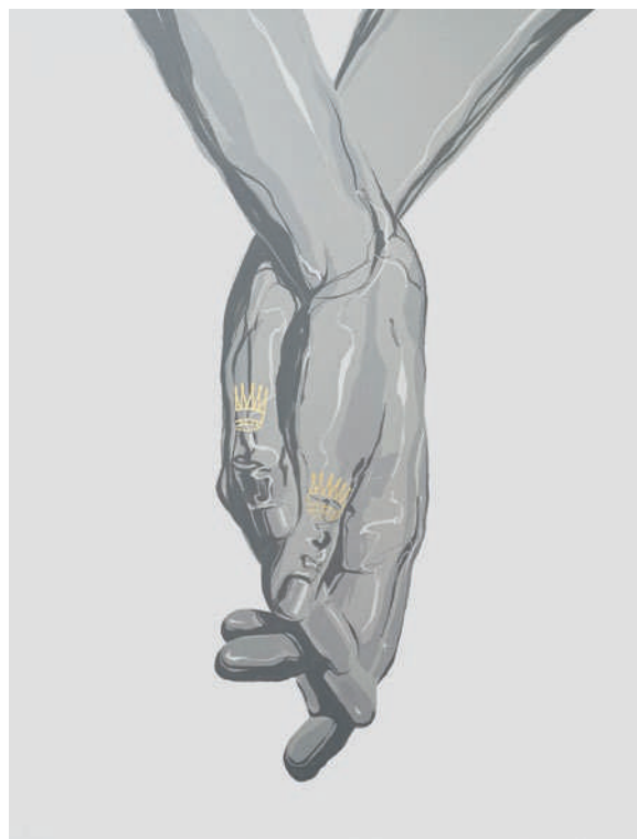
MAHN KLOIX Two Kings Acrylique sur toile 116x89cm 2021