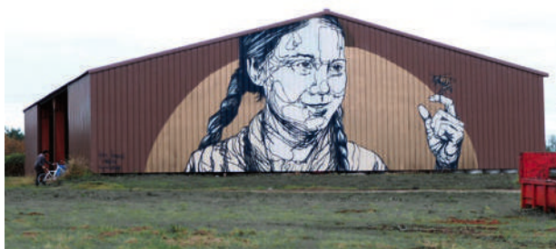
Greta Thunberg, Eauze 2019