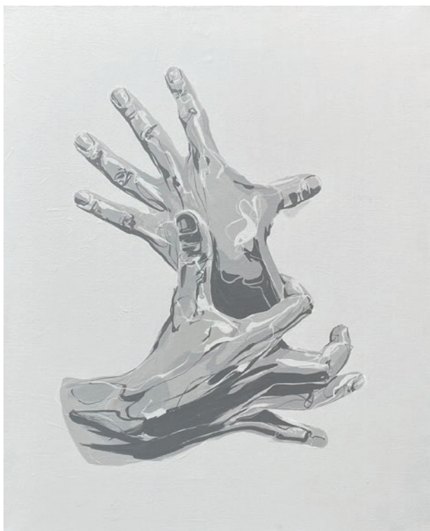
MAHN KLOIX Résilience Acrylique sur toile 73x60cm 2021