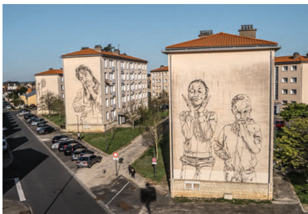
Projet À caractères Uniques, Poitiers 2021