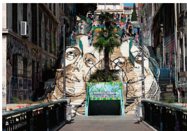
Escaliers Cours Julien, Marseille 2018