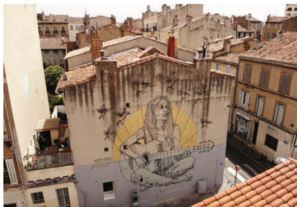
Nûdem Durak, Marseille 2020